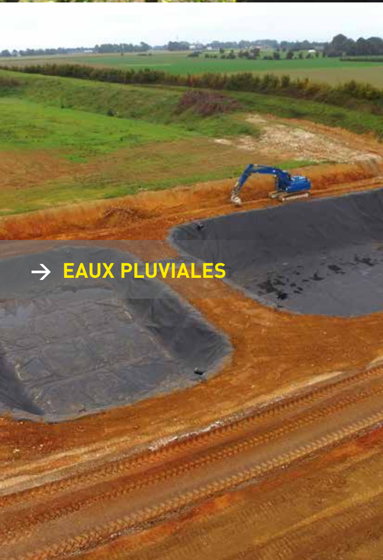
→ EAUX PLUVIALES