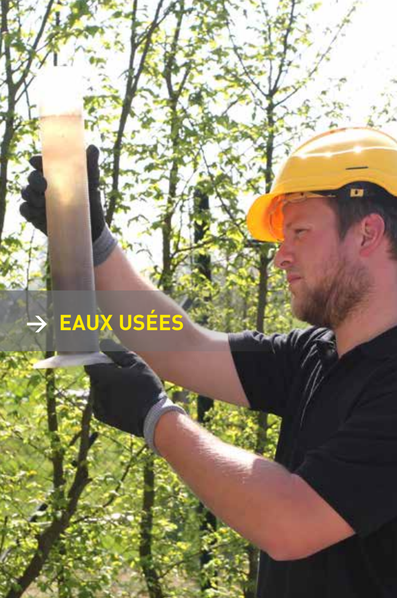
→ EAUX USÉES