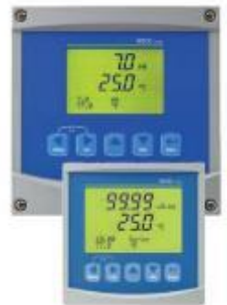
Mesure de pH