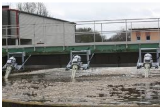
MONTAGE SUR CADRE EN REMPLACEMENT D'UN PONT BROSE

En lagunage aéré, en bassin à boues activées, ou en bassin d'eaux usées, les aérateurs à vis hélicoïdales FUCHS assurent, en plus d'une aération profonde par fines bulles, un déplacement horizontal de l'eau ainsi qu'un mélange intense dans le bassin. Avec plus de 40 ans d'expérience, les aérateurs à vis hélicoïdales FUCHS ont démontré leur efficacité : faciles à installer (pas de modification de génie civil), économiques, performances garanties, appareils robustes (5 ans de garantie, limitée à 2 ans pour le moteur et les roulements)