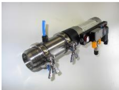
Piston de prélèvement sur conduite