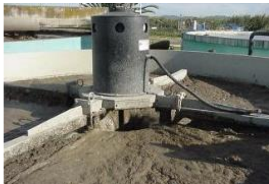
EXEMPLE DE MONTAGE TRAITEMENT DES GRAISSES A NIVEAU VARIABLE