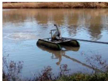
MONTAGE SUR FLOTTEURS POUR NIVEAU VARIABLE

Les aérateurs à vis hélicoïdale FUCHS créent une circulation dans le bassin ou la lagune, neutralisant les zones mortes et générant une répartition homogène de l'oxygène dans toute la masse