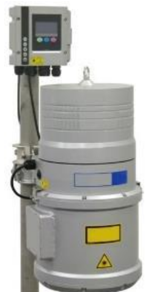
ODL 1610 Variation de niveau d'eau jusqu'à 10 m