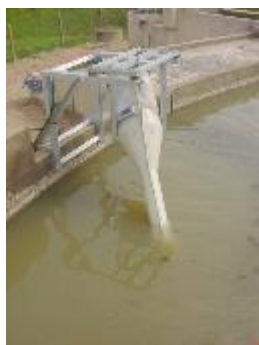
MONTAGE SUR VOILE DE BASSIN POUR NIVEAU FIXE