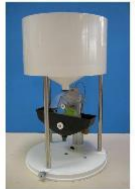
Pluviomètre à auget