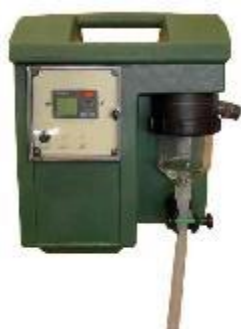
VERSION PORTABLE SL10DA00 Pour prélèvements ponctuels