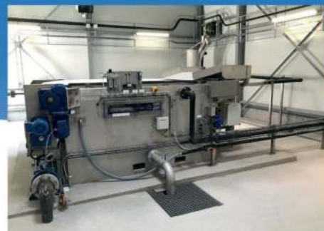
TABLE D'ÉPAISSISSEMENT DE BOUES SANS POLYMÈRES DÉSHYVAC

Le Rotec est un tamiseur rotatif à alimentation interne : un trommel. Le Rotec se décline également en version pour matières de vidange ou matières de curage.